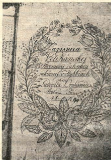
Zápisnica stromovej záhrady.

ovocnej záhrady“, chtiac hospodársky pomôcť chudobnému podtatranskému ľudu. Ale toto keď sa neuskutočnilo, zakladá sám na svoje útraty „velikánsku stromovú záhradu“ hneď za kostolom, sledujúc ten istý cieľ „potomstvu pamiatku zanechať a sebe samému milú, užitočnú, nevinnú zábavu a zamestnanie zaopatriť“. Pevnou vôľou a odhodlanosťou dáva sa do práce, tvrdiac, že „ten, kto opravdove chce, zmôže mnoho, veľmi mnoho“. Človek svoju mladost