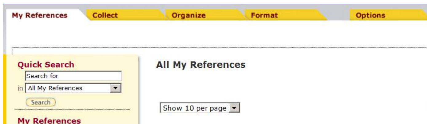
Obr.5: My References

My References – ponúka jednoduchú organizáciu a vyhľadávania na globálnej úrovni.