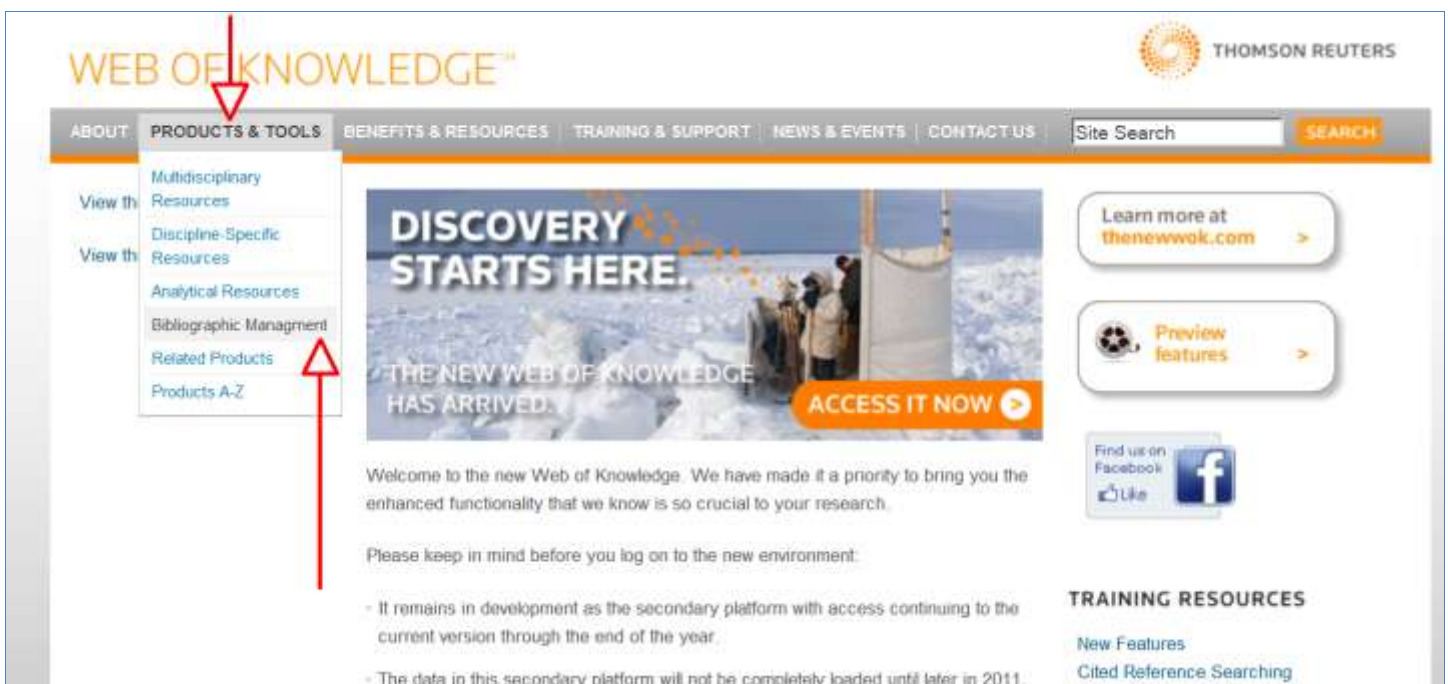
Obr. 4: Prístup cez pripravované rozhranie ISI Web of Knowledge