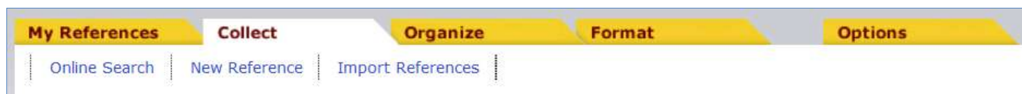
Obr. 5: Collect

Collect – Spustenie online vyhľadávania v databázach ISI Web of Knowledge (Online Search); spracovanie novovyhľadaných záznamov (New Reference); import zoznamov z iných databáz, napr. ScienceDirect (Import References).